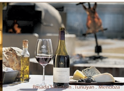
Posada Salentein . Tunuyán . Mendoza