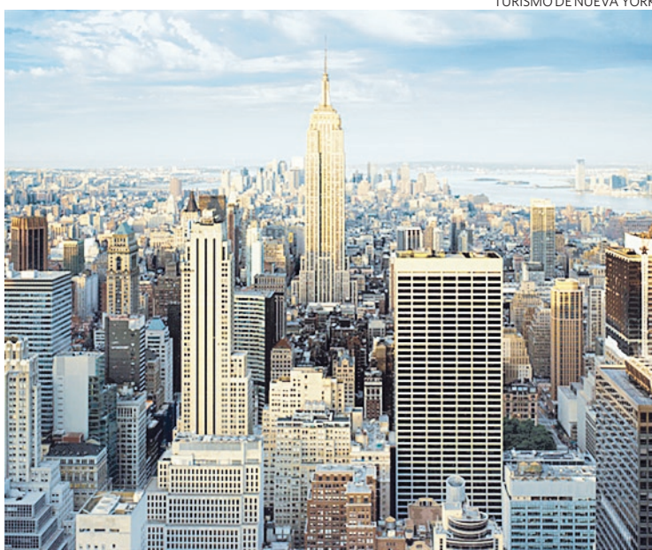
Oportunidad. Las tarifas de hoteles neoyorquinos bajan en enero y febrero.

VÁLIDO INGRESANDO SÁB. Y DOM. DEL 5/01 AL 17/03 DE 2013. EXCEPTO 9 Y 10 DE FEBRERO.