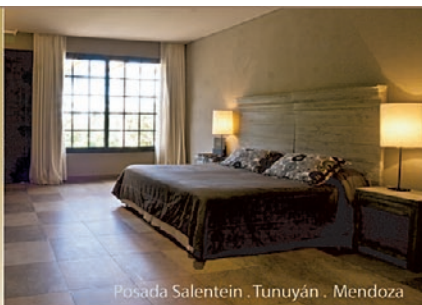
Posada Salentein . Tunuyán . Mendoza

Beber con moderación - Prohibida su venta a menores de 18 años